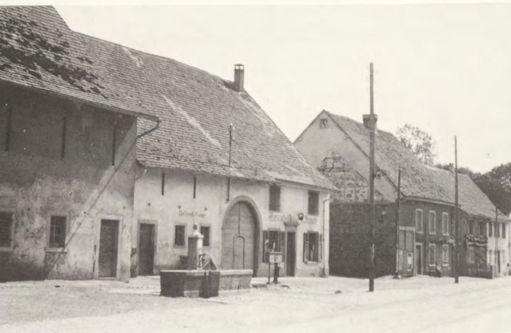
Das Dannacherhaus um 1920 mit öffentlicher Waage und Wirtschaft