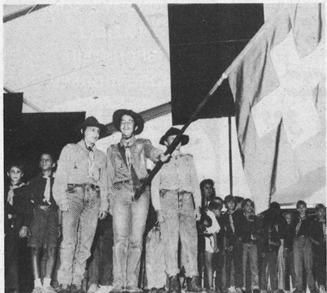
Eröffnungsakt der Jubiläumsfeier mit Abteilungsfahne.