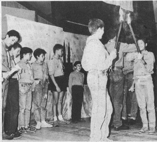
Theaterstück über 75 Jahre.