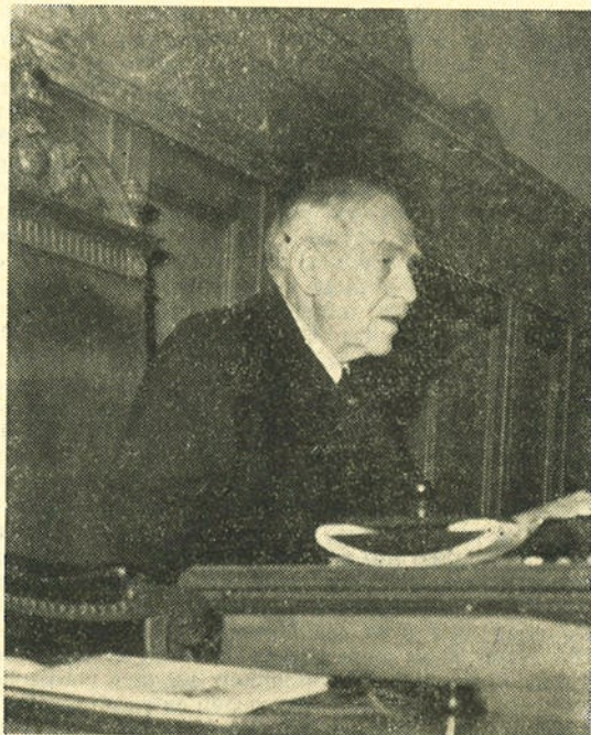
Bei der Eröffnung der neuen Legislaturperiode am 1. Dezember 1947.