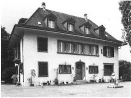
17. Villa „Im Byfang“, später Katzenmuseum, Aufnahme 1994.

Teil von Parz.-Nr. B 862 (1934–1976; Parz.-Nr. A 73)