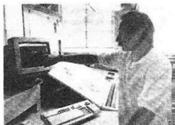
Kontrolle von Druckvorgang und Druckqualität am Bildschirm