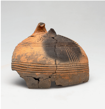
Riehen, Haselrain: 3300 Jahre alte Backhaube oder -glocke aus Keramik.