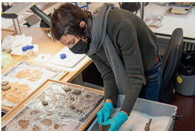
Zusammenkleben eines grossen Vorratsgefässes im Konservierungslabor der Archäologischen Bodenforschung am Petersgraben.