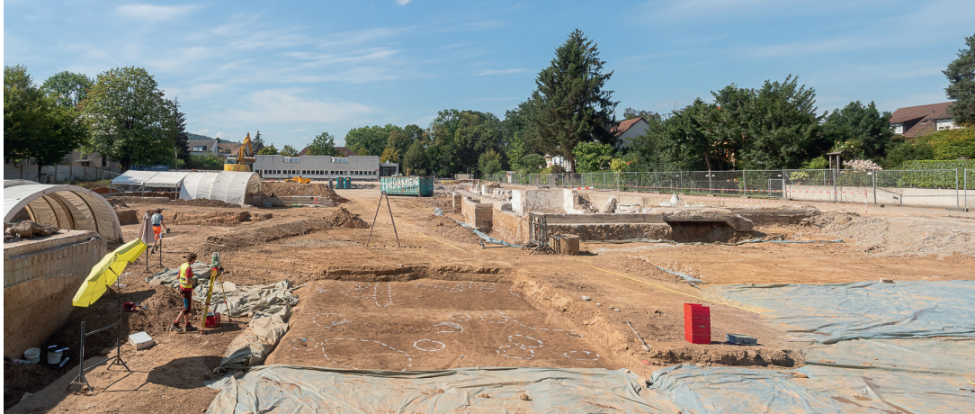
Die grossflächige Rettungsgrabung 2020 auf dem Areal der ehemaligen Gehörlosen- und Sprachheilschule.