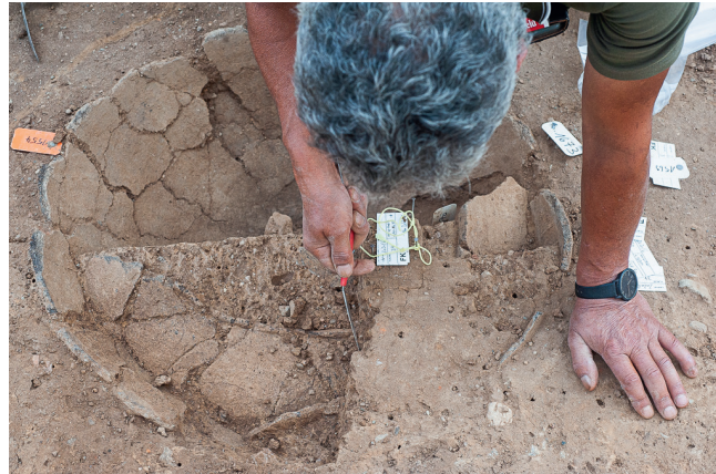
Riehen, Inzlingerstrasse: Freilegen eines grossen Vorratsgefässes, das ursprünglich im Boden eingegraben war und dessen Ränder ins Innere des Gefässes gestürzt sind.

einem Römertopf. Parallelen zur Riehener Backhaube finden sich während der Spätbronzezeit hauptsächlich in Bosnien, Kroatien, Slowenien, Ungarn und Mittelitalien. Kürzlich wurde im nahen Elsass ein vergleichbares Stück entdeckt.