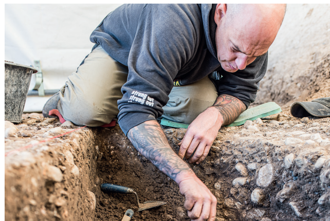
Riehen, Haselrain: Freilegung einer Grube, in der im Rahmen einer rituellen Handlung vor 3300 Jahren unzählige Scherben niedergelegt wurden.

auch Hinweise auf Fischfang mit Netzen und Angelhaken sowie auf die Jagd von Wildtieren sind in anderen bronzezeitlichen Siedlungen präsent. Für Sammelwirtschaft sowie Fischfang und Jagd waren die nahen Flussauen der Wiese und des Rheins sicherlich von grosser Bedeutung. Diese Tätigkeiten belegen mehrere Pfeilspitzen aus Feuerstein beziehungsweise Silex im Fundmaterial. Pfeilbogen wurden aber auch als Waffen benutzt.