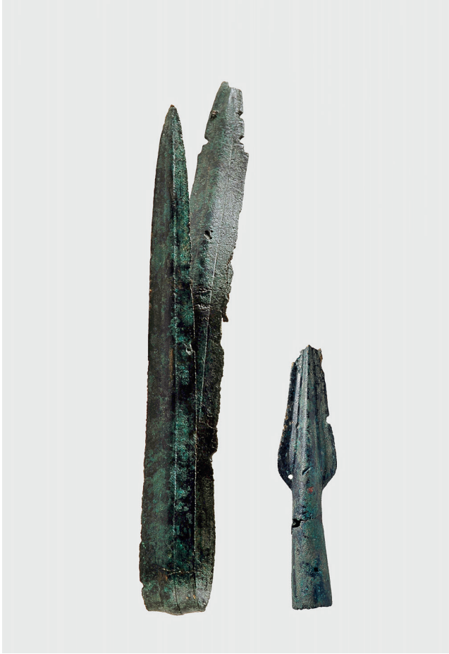
Riehen, Burgstrasse: Weihefund eines rituell verbogenen Stichschwerts und einer Lanzen Spitze aus der Zeit um 1300 v. Chr.

Beschreibungen des Trojanischen Krieg in der «Ilias» schildert. Auf dem Areal des Novartis-Campus wurde ein Bronzemesser mit einem als menschlicher Kopf ausgestalteten Griffende gefunden, das aus Nordeuropa stammen muss. Möglicherweise gelangte es auf einem Schiff den Rhein hinauf nach Basel. In Grossbritannien sind bis zu 15 Meter lange bronzezeitliche Boote aus Eichenplanken gefunden worden. In Südschweden gibt es zahlreiche