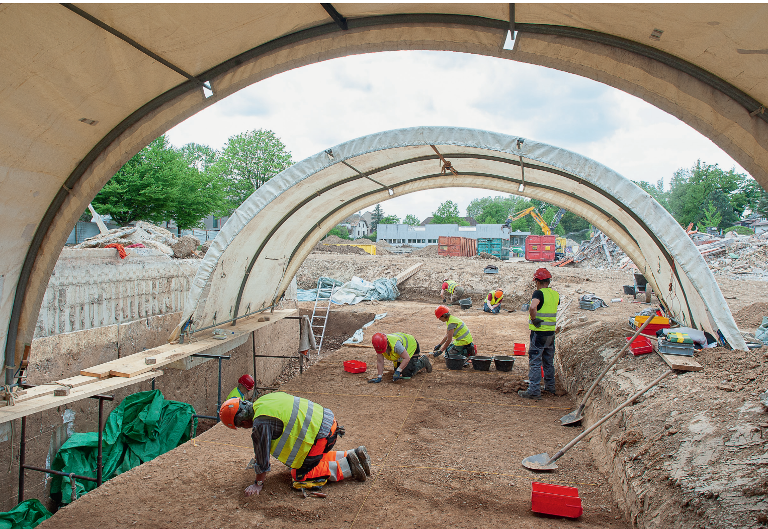
Freilegen der bronzezeitlichen Kulturschichten während der Ausgrabung im Jahr 2020.