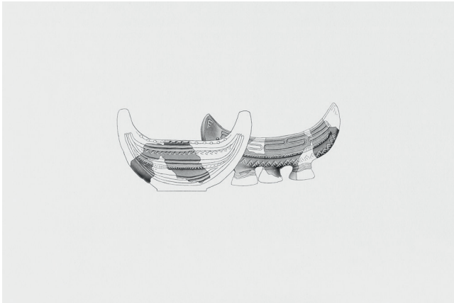
Basel, Theodorskirchplatz (vorne), und Bötzingen am Kaiserstuhl (hinten): Rekonstruktionszeichnung von zwei spätbronzezeitlichen Mondhörnern.

Ebenfalls in den rituellen Bereich gehört der Fund von zwei Mondhornfragmenten in der Siedlungsstelle an der Inzlingerstrasse. Mondhörner wurden in der Spätbronzezeit meistens aus Ton hergestellt und oft auf einer Seite mehr oder weniger reich verziert. Es gibt sie als gedrungene, barrenförmige Exemplare mit nur angedeuteten Hörnern bis hin zu eleganten Versionen mit Standfuss und vollplastisch ausgeformten Hörnern. Vergleicht man sie mit Kultobjekten aus anderen archäologischen Kulturen, können sie Mondsicheln, Schiffe oder präparierte Tierschädel mit Hörnern symbolisieren. Wahrscheinlich dienten die während der Spätbronzezeit weit verbreiteten Mondhörner bei religiösen Ritualen als Idole oder als eine Art Kalender.