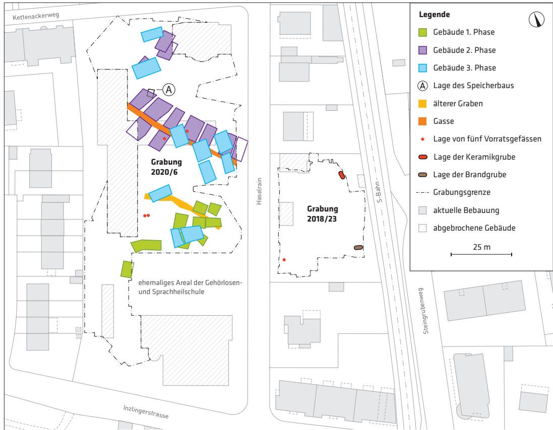
Plan der Grabungen am Haselrain (2018/23) und an der Inzlingerstrasse (2020/6) mit den Standorten der bronzezeitlichen Gebäude der Siedlungsphasen 1 bis 3.