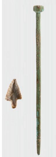
Riehen, Inzlingerstrasse: Bronzenadel und Silexpfeilspitze aus der bronzezeitlichen Kulturschicht.