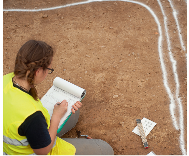
Riehen, Inzlingerstrasse: Dokumentation eines bronzezeitlichen Befunds, der sich als Hausgrundriss abzeichnet.

Von den aufgehenden Konstruktionsteilen der Pfostenbauten sowie der Gebäude mit Schwellbalken haben sich ledig-