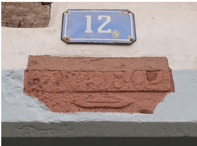
198. Türsturz von Spitalweg 12 mit der schlecht lesbaren Inschrift «HIS 1804», darunter vermutlich die Darstellung eines Weberschiffchens (2022).