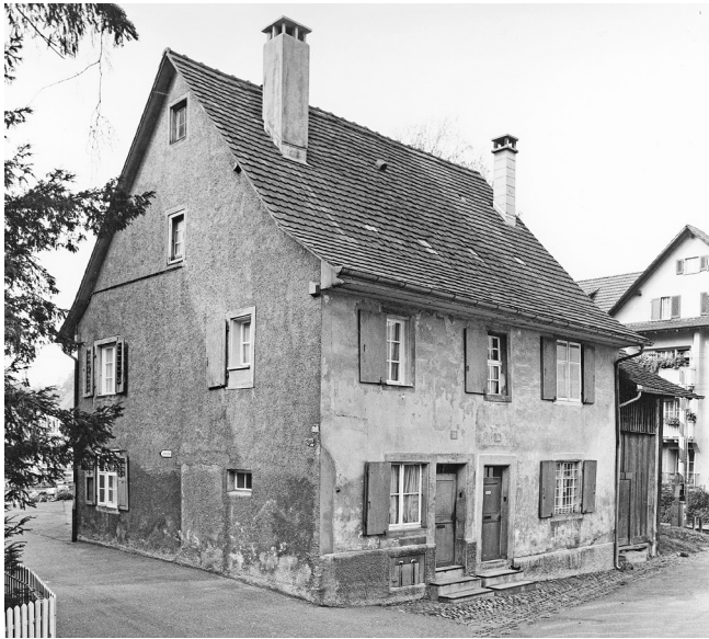
197. Spitalweg 10–12, die ehemals verputzten Fassaden der Taunerhäuser (1975).