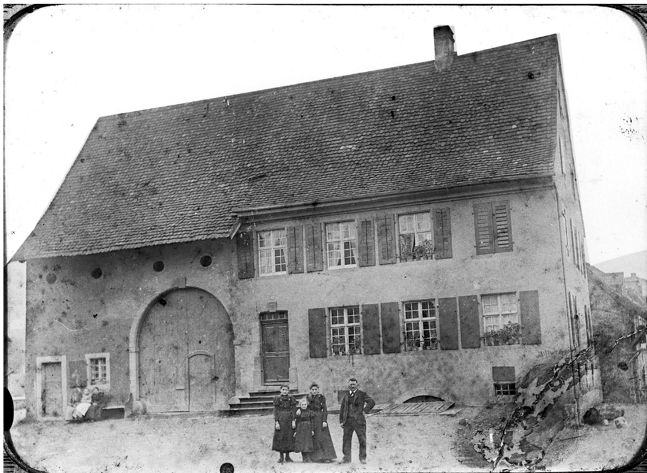
168. Rössligasse 44, Hauptfassade (nach 1890).