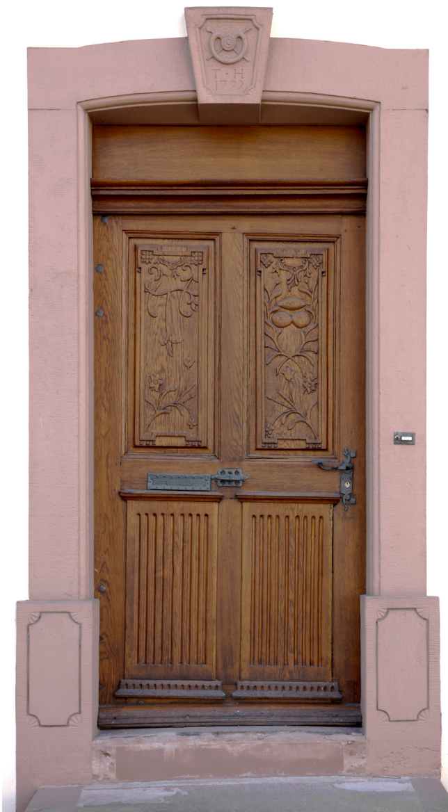
173. Rössligasse 44, Haustür (2022). Auf dem Sturz die Jahreszahl 1799, die Initialen TH (Theobald Höner) sowie ein Brezel und überkreuzte Einschussbretter.