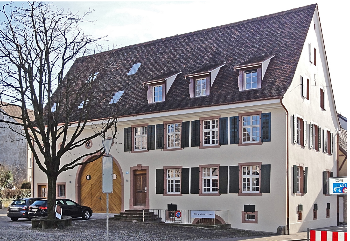
174. Das Haus mit der Rekonstruktion der Fassade des Wirtschaftsteils (2011).