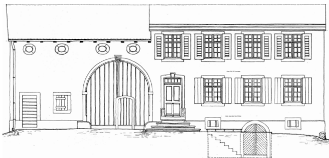
169. Rössligasse 44, Hauptfassade in einem Plan des Technischen Arbeitsdiensts Basel-Stadt von 1933.

lang ein entsprechendes Institut in Bischofszell geführt. 14 Zöglinge ist die höchste fassbare Zahl, die Altersspanne lag zwischen 7 und 17 Jahren. Mehrheitlich stammten sie aus verschiedenen Gegenden der Schweiz, vereinzelt jedoch auch aus Deutschland und Frankreich. Die Unterrichtsfächer waren Religion, biblische Geschichte, Deutsch, Französisch, Italienisch, Latein, Schönschreiben, Zeichnen, Rechnen, Geometrie, Geografie, Naturkunde und Geschichte.