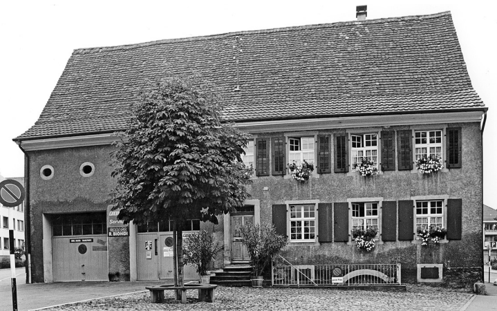
172. Das Haus Rössligasse 44, mit den Garageneinbauten im Wirtschaftsteil (1980).

Auf der Rückseite des ehemaligen Wirtschaftsteils befindet sich eine moderne Laube in Holzkonstruktion, die das Volumen der ursprünglichen Laube einnimmt, die hier angebracht war, weil die Parzelle den Anbau einer Laube am Wohnteil nicht erlaubt hätte. Das ehemalige Hofareal ist mehrheitlich überbaut mit eingeschossigen Gebäuden, auf denen sich Dachterrassen befinden. Das vielfach veränderte rückwärtige Wirtschaftsgebäude hat seit 2009 das Erscheinungsbild eines schlichten, zweigeschossigen Wohnhauses mit drei Fensterachsen gegen die Wendelingsgasse (siehe Wendelingsgasse 31).