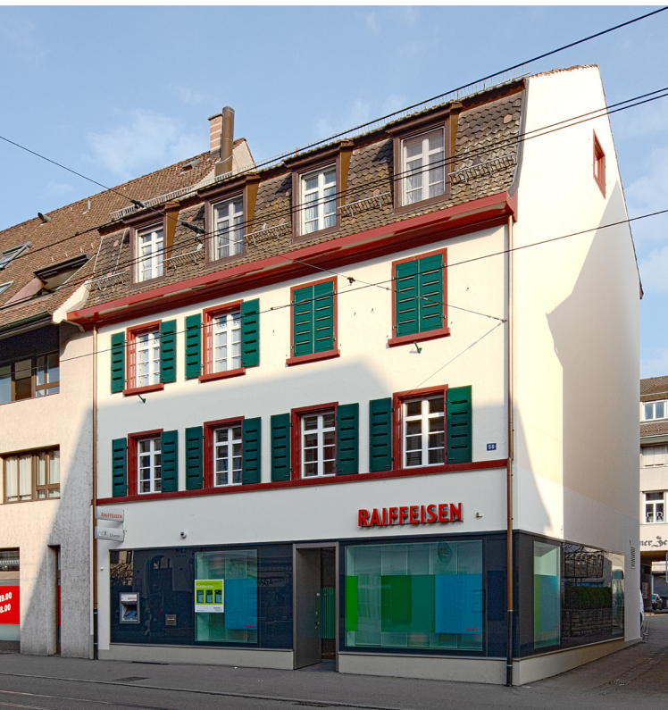
120. Baselstrasse 56, Strassenfassade und Seitenfassade gegen das Schopfгässchen (2022).

in vier Fensterachsen gegliedert. Es umfasst drei Vollgeschosse und ein ausgebautes Dachgeschoss im unteren Bereich des Mansarddachs, auf das die vier den Fensterachsen der Fassade entsprechenden Fenster über der Trauflinie verweisen. Das Erdgeschoss erscheint seit dem Umbau zur Bankfiliale 2007 als mehrheitlich dunkles, mit schmalen Metallprofilen eingefasstes Glasband, das auch um die Ecke der Seitenfassade zum Schopfгässchen gezogen ist. Der Eingang befindet sich in der dritten Fensterachse.