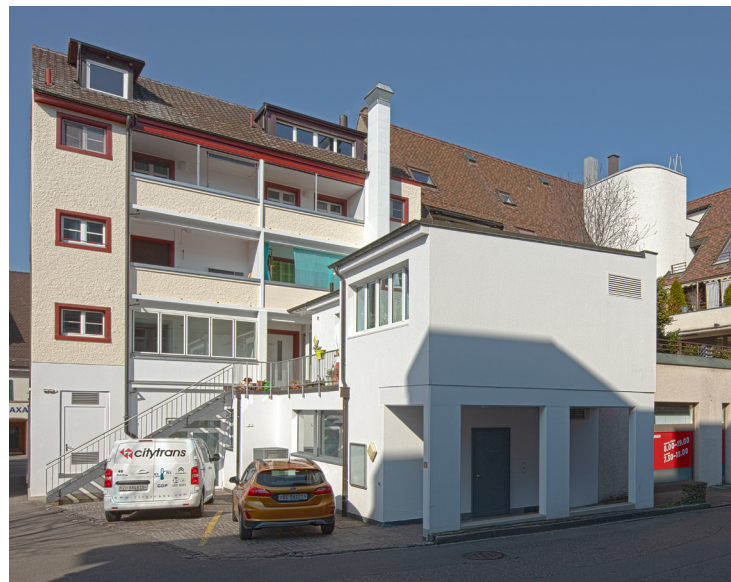
121. Baselstrasse 56, Rückseite mit Flügelbau rechts (2022).