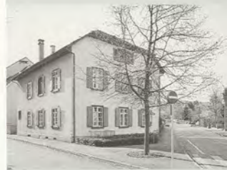
Anlass für die Impressionen des Fotografen Andreas F. Voegelin aus dem Kindergarten an der Schmiedgasse war die Übernahme der Kindergärten durch die Gemeinde Riehen im Schuljahr 1996/97.

Über ein halbes Jahrhundert später, 1982, wurde im Rahmen der Autonomiegespräche erstmals über die Übernahme der Kindergärten durch Riehen und Bettingen diskutiert; die beiden Landgemeinden begrüßten diesen Vorschlag. Doch bis es dazu kam, sollten 14 Jahre mühsamer und zäher Verhandlungen verstreichen. Widerstand erwuchs der Idee vor allem von den Kindergartenlehrkräften selbst. Sie sahen insbesondere die pädagogischen Ziele und ihre Mitspracherechte in Frage gestellt. Der Grosse Rat folgte in der Debatte vom März 1985 den Argumenten der Gegnerinnen und Gegner und wies die Vorlage mit 52 zu 36 Stimmen an die Regierung zurück. Riehen aber liess nicht locker und suchte in den nächsten Jahren immer wieder das Gespräch mit allen Beteiligten. Im Jahre 1990 endlich gelangte man zu einer Einigung, die auch vom Gemeinderat gutgeheissen wurde. Nun aber hatte auf einmal der Kanton kein Interesse mehr an Verhandlungen; sie wurden erst anfangs 1994 wieder aufgenommen. Die Abstimmung vom 19. November 1995 fiel knapp aus: mit 23'022 gegen 21'618 Stimmen wurde der Übernahme von heute 22 Kindergärten, davon zwei neu eröffneten, zugestimmt. Die Riehener Stimmbürgerinnen und Stimmbürger sprachen sich jedoch mit 2638 zu 3620 Stimmen klar gegen die Vorlage aus.