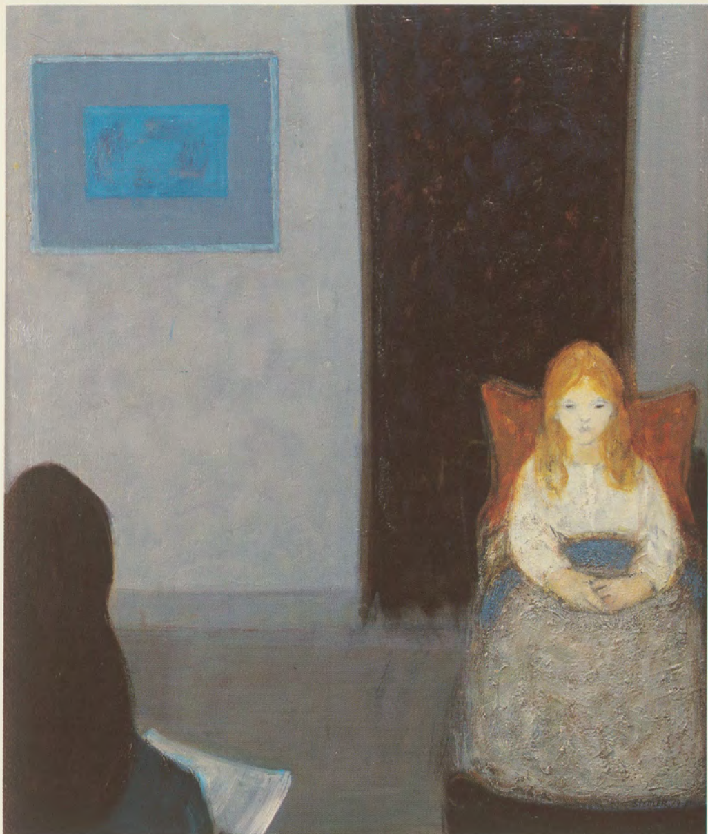
Märchenstunde. 1979–1983. Öl, 120 × 100 cm