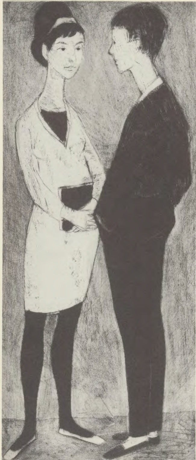
Zwei Teenagers. 1967. Radierung, 58 × 25 cm