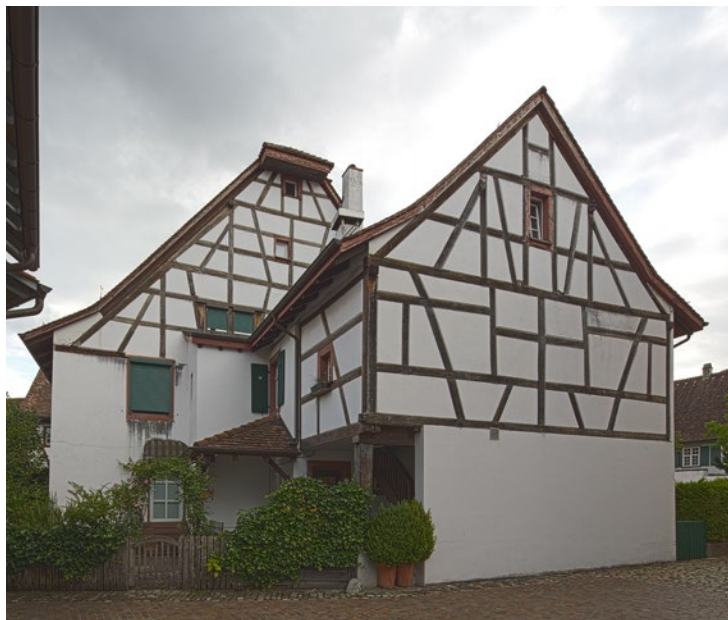
50. / 51. Haus Baselstrasse 27, links die Strassenfassade, rechts rückwärtiger Bereich (2017).